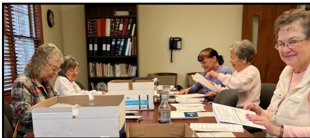
Voluntarias de Senior Sounds